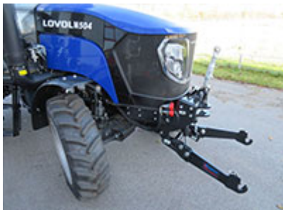
Frontkraftheber – Art. Nr.

FKH-M504: FH 10-4, doppelwirkend Hubkraft 10kN, Unterlenker Kat. I hochklappbar mit Schnellkuppel-Fanghaken Kat. I inklusive Umschaltventil, doppelt-/ einfachwirkend mit Spindeloberlenker M30